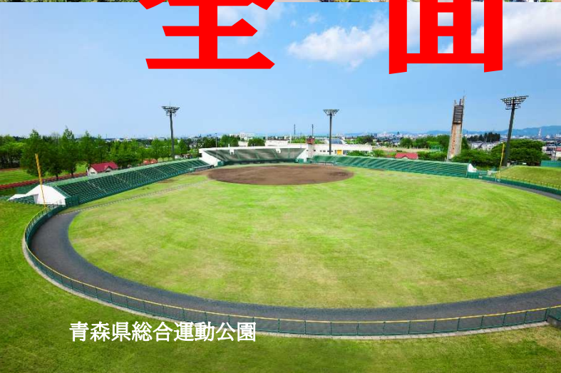
青森県総合運動公園